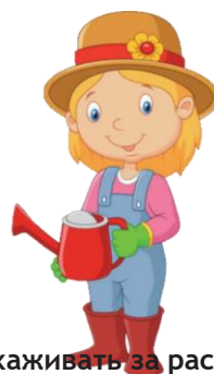
Ухаживать за растениями: