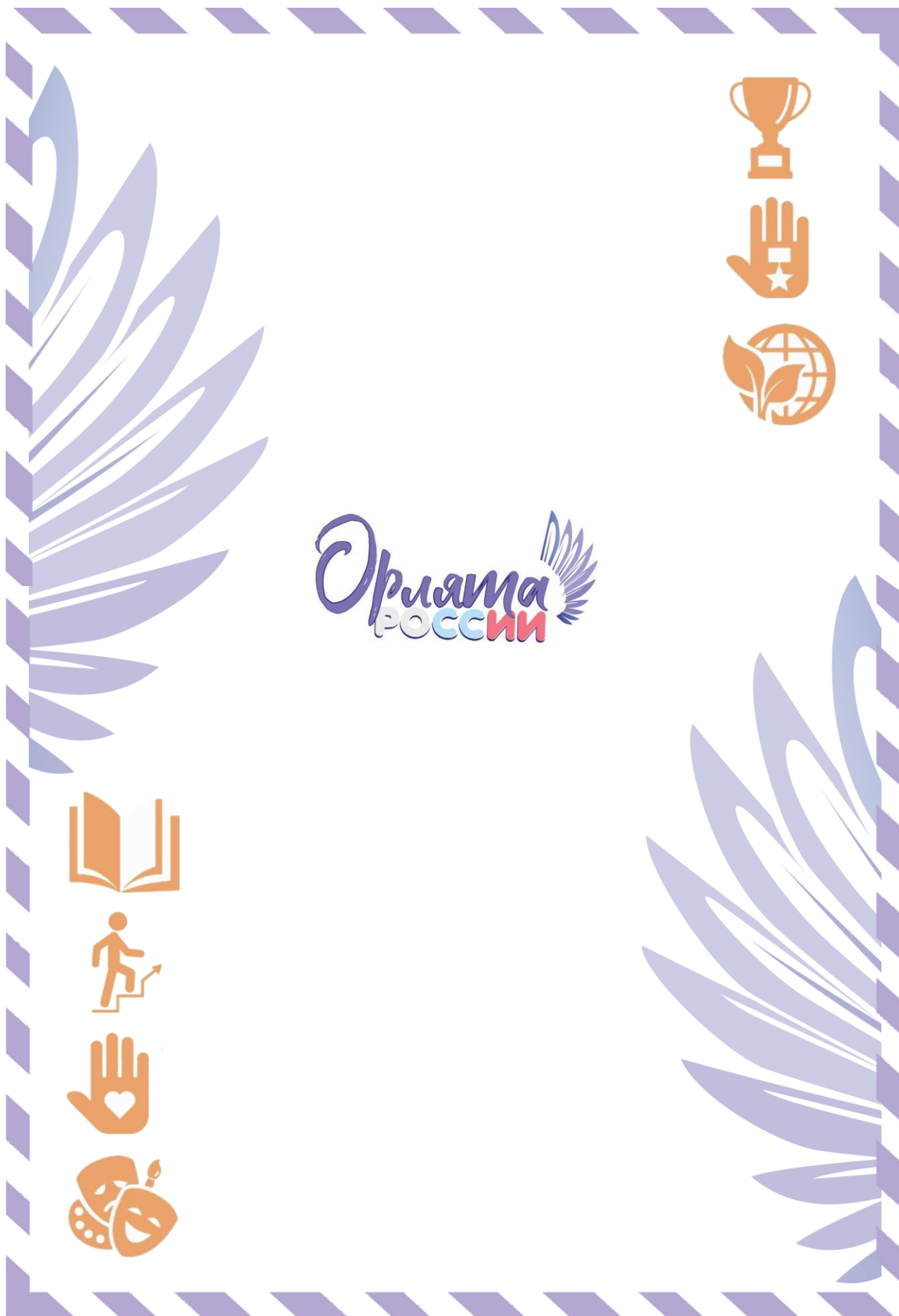
Рис. 2. Обратная сторона «Письма в Будущее»