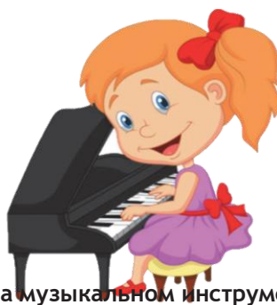
Играть на музыкальном инструменте: