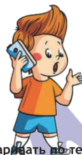
Разговаривать по телефону: