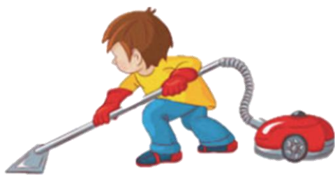
Наводить порядок дома: