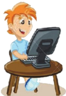
Играть в компьютерные игры: