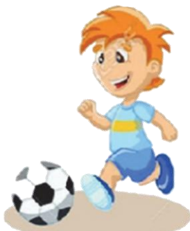
Играть в футбол: