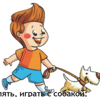
Гулять, играть с собакой: